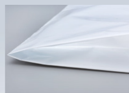
Soufflet de fond

Les pochettes postales DEBAPOST™ en polyéthylène haute résistance opaque destinées à l'envoi de courrier et d'articles de prêt-à-porter, peuvent être imprimées de manière personnalisée. En version à double fermeture permanente, elles conviennent également aux envois retours de produits. Un pochon porte-documents extérieur peut-être rajouté sur demande. Nos pochettes postales ont un coefficient de frottement compris entre 0,15 et 0,20, conformément à la norme ISO 8295 et répondent ainsi aux préconisations de DHL.