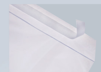
Avec 10 mm de fermeture permanente

Les pochettes postales et pochettes de retour DEBAPOST™ conviennent particulièrement au reconditionnement d'articles de prêt-à-porter après leur retour. Grâce à leur fabrication en polyéthylène haute résistance transparent et à leur fermeture adhésive permanente de 10 mm, les ré-envois bénéficient d'une protection et d'un transport optimisés. Elles sont disponibles en format standard avec des mises en garde types en plusieurs langues ou personnalisables.