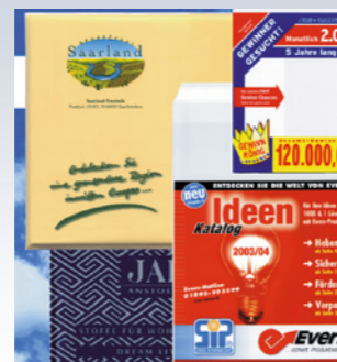
Support publicitaire idéal : pochettes postales personnalisées avec jusqu'à 6 couleurs d'impression